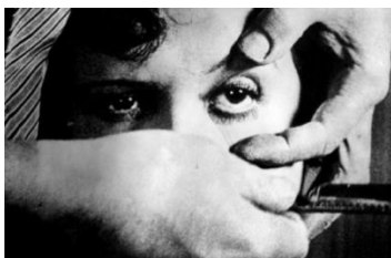
Título: Autor : Estilo:

4. Identifique la obra, el autor y estilo al que pertenece. El fallo de una pregunta no penaliza (máximo 2 puntos)