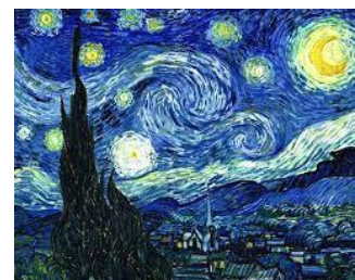
Título: Autor : Estilo: