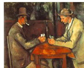
Título: Autor : Estilo: