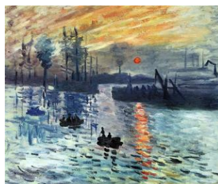
Título: Autor : Estilo: