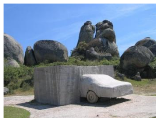
Título: Autor : Estilo: